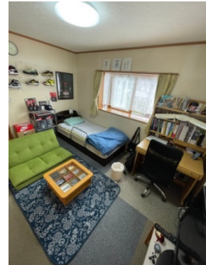
自分の部屋の中でおしゃれだと思う場所 (10代男性)