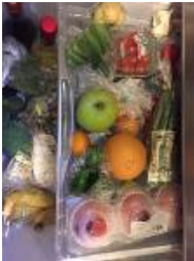
冷蔵庫の野菜室の様子 (30代女性・主婦)